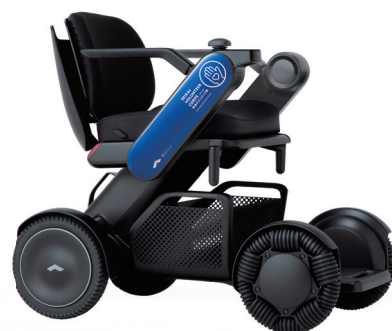
WHILL Model C2 3号車