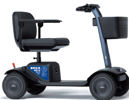
WHILL Model S 2号車