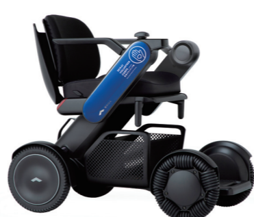
WHILL Model C2 3号車 寄贈：三菱UFJ銀行 半田支店さま