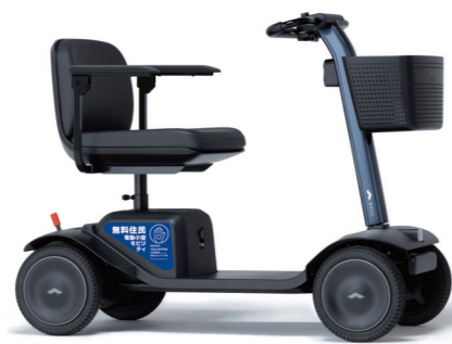
WHILL Model S 2号車 寄贈：阿久比グリーン株式会社さま